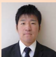
齋藤事務職 (西浦中学校より)