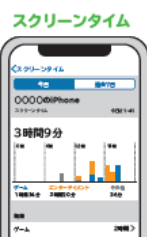
スクリーンタイムの設定方法(動画)