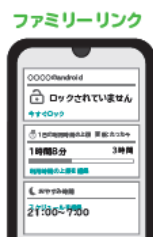
ファミリーリンクについてはこちらから

POINT 2 各ゲーム機にもペアレンタルコントロールのサービスがあります。各説明書やホームページなどで確認し、最初に設定しましょう。