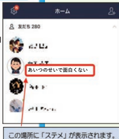
この場所に「ステメ」が表示されます。

誰に対するメッセージかを明確にせずに、読む人が読めば分かるような悪口を書きいじめやトラブルが増えています。