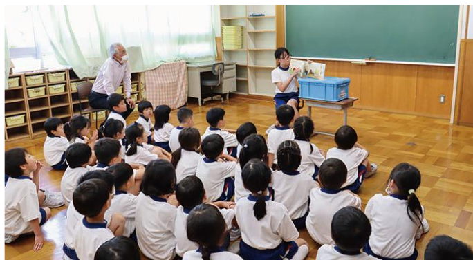
図書委員による読み聞かせ委員