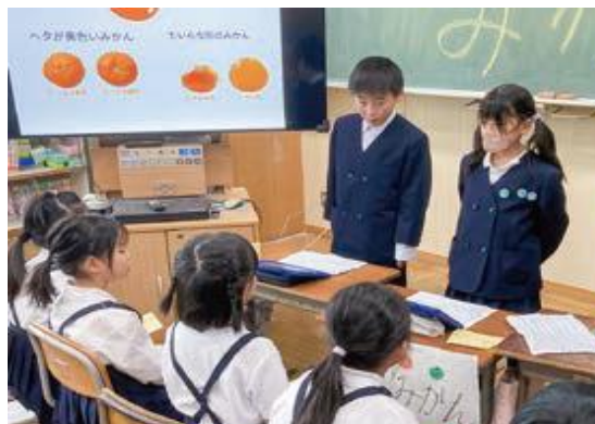
調べたことを 分かりやすく伝える力