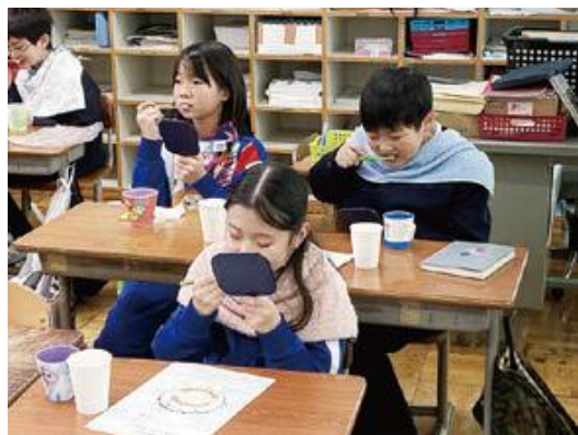
キッズブラッシング教室