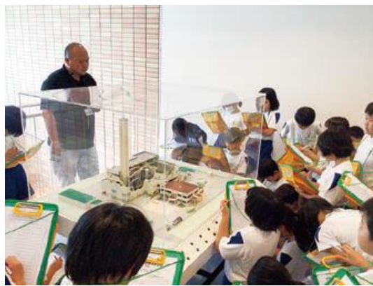
清掃センターの見学