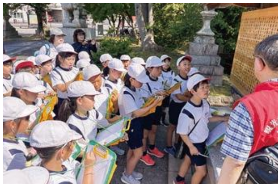
氣比神宮の見学 (松尾芭蕉像や句碑等)