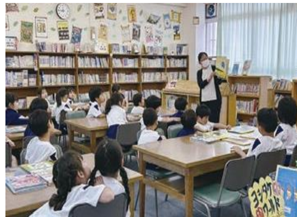
図書ボランティア