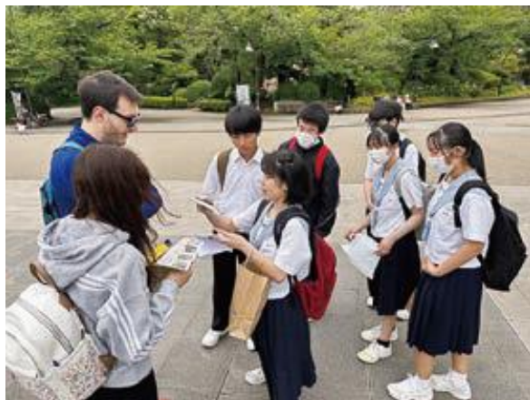
ふるさと敦賀の発信