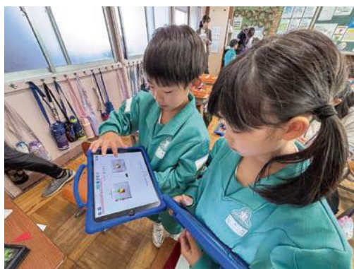
自分の言葉で説明