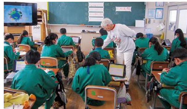
外国語活動支援員との指導