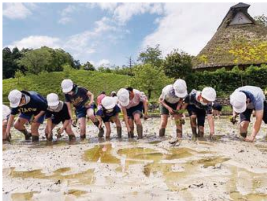
田植え・稲刈り体験