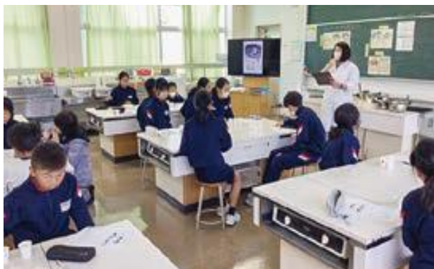
栄養教諭による 「出汁のうまみを感じよう」