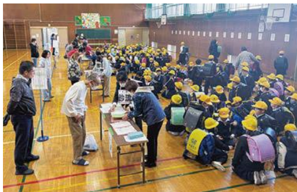
引き渡し訓練 (非常時への備え)