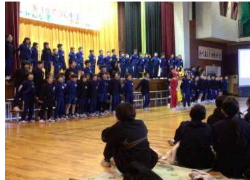
【4年】見つけ出せ、中央ピクミン