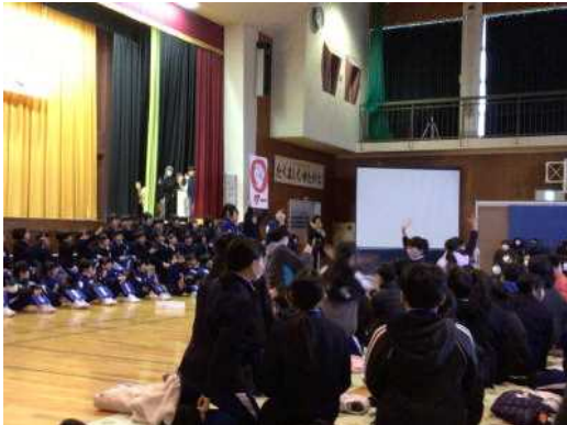
【5年】幕間 じゃんけん大会