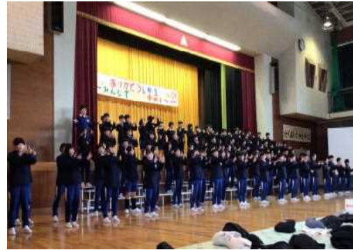
【6年】ありがとう中央小学校