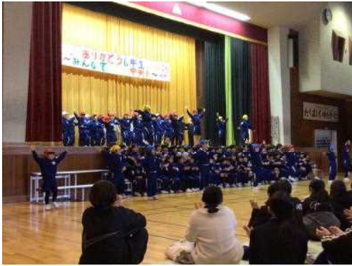
【1年】ありがとういっぱい