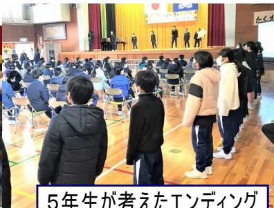
5年生が考えたエンディング