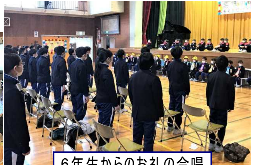
6年生からのお礼の合唱

5年生は運営・進行で会全体を盛り上げてくれました。ハキハキと分かりやすい司会、楽しい幕間の寸劇や感想を聞くインタビュー、入場から終了後の退場まで、常に6年生のことを考えて隙間のない“おもてなし”をしてくれました。その1人1人の動きは、6年生から中央っ子のリーダーのバトンをしっかり受け継いでくれた責任感を大いに感じました。そして、6年生からはそれぞれの学年へ向けたいお礼のメッセージや合唱の披露がありました。温かく心のこもったすばらしい時間でした。