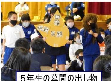
5年生の幕間の出し物

会の最後には、PTAの有志の方々が作成してくださった思い出DVDの上映もありました。