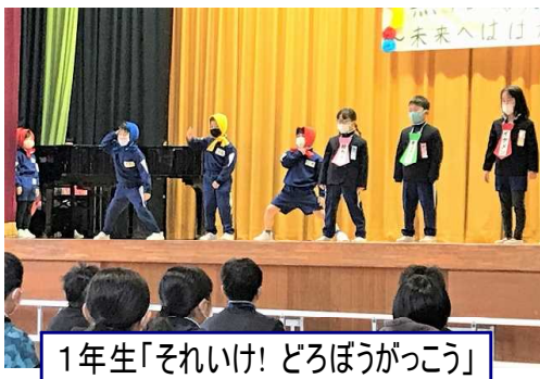
1年生「それいけ! だろぼうがっこう」