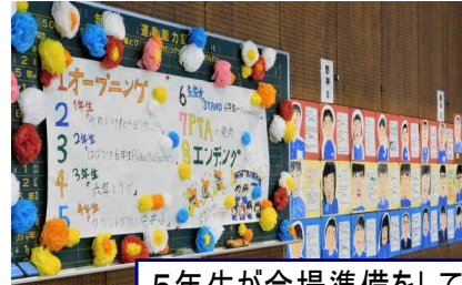
5年生が会場準備をしてくれました

2月26日(金)に6年生を送る会を行いました。感染症対策のため、各学年が入れ替わりながら出し物をしました。保護者の皆様にも参観者シートのご持参や出し物ごとの交代のご協力をいただきましてありがとうございました。