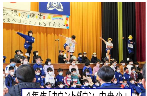
4年生「カウントダウン 中央小」

会の最後には、PTAの有志の方々が作成してくださった思い出DVDの上映もありました。