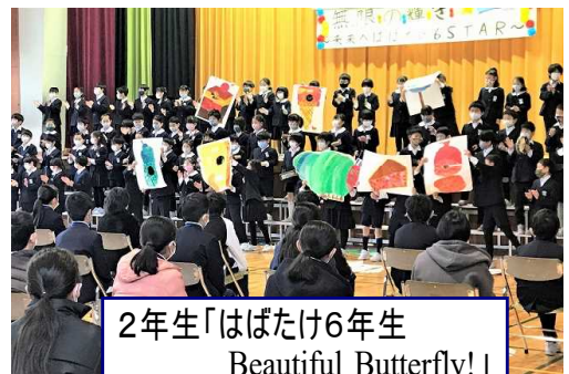
2年生「はばたけ6年生 Beautiful Butterfly!」