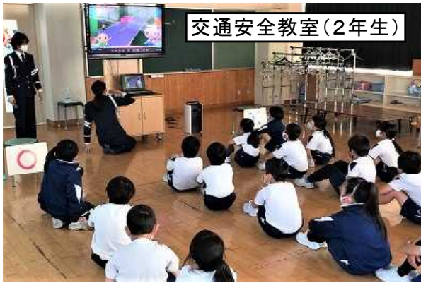
交通安全教室(2年生)