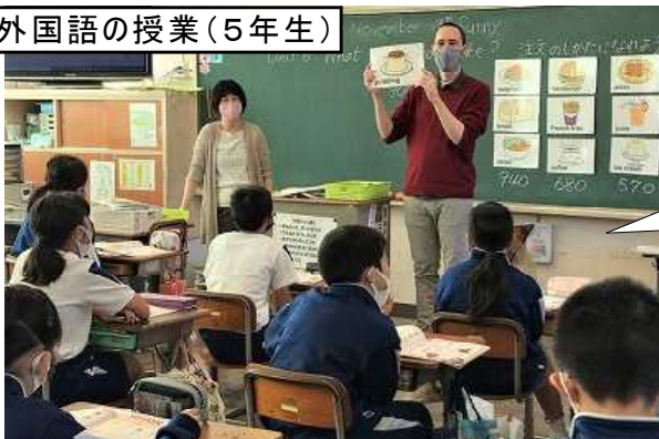
外国語の授業(5年生)