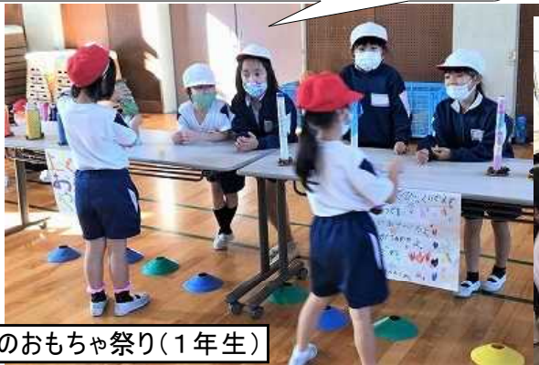
秋のおもちゃ祭り(1年生)