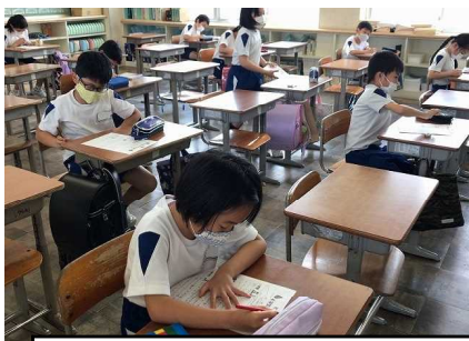
新しい学年のめあてを作る活動もしました