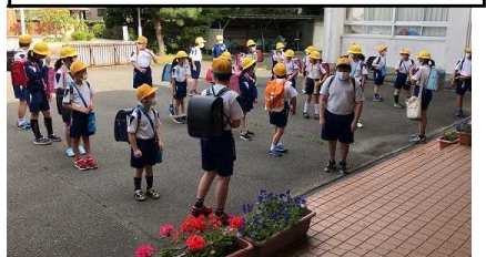
登校時に玄関で先生がチェックしました

5月25日(月)～28日(木)には分散登校を実施しました。密集を避けながら学校生活を開始するための準備期間として地区ごとの2つのグループに分かれて登校しました。約半分の児童数とはいえ、子どもたちは久しぶりの再会に嬉しそうに時間を過ごしました。初めての集団登校となる1年生は少し緊張しながら歩いていましたが、登校班の班長さんが学校に着いた後も一緒に教室まで案内してくれたので、安心して入ることができました。