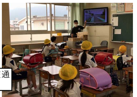
地区集会ではテレビを使った交通安全についての指導もありました