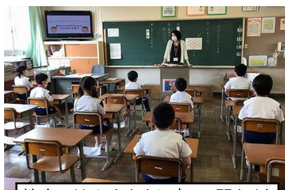
教室では1人おきに座って間かくをとり、先生の話を楽しみました。