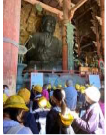
大仏様は大きかった！

校外学習や修学旅行は天候にも恵まれ、どの学年も多くの収穫とともに、充実した様子で元気に帰校してくれました。学んできたことを使って、学校生活の中でどんどん活躍してくださいね。11月に校外学習に出かける学年もありますね。まだまだ〇〇の秋はつづきます。過ごしやすいこの季節を満喫し、もっともっといろいろなものを収穫できるといいね。