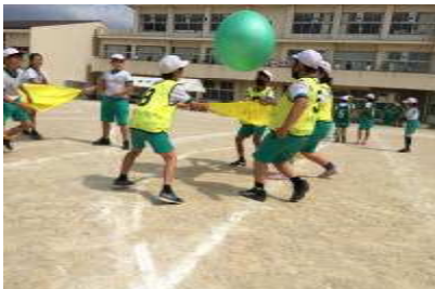
4年生 心をつにワンチーム