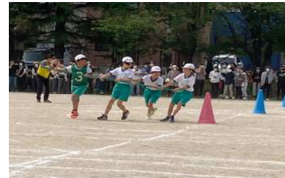
3年生 かがやきよとどけ！くるくる宇宙旅行