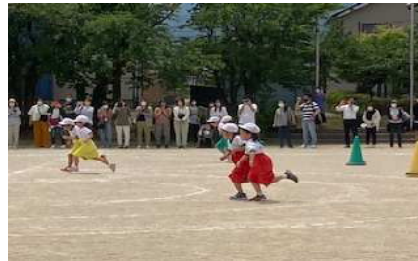
2年生 テカパンリレー