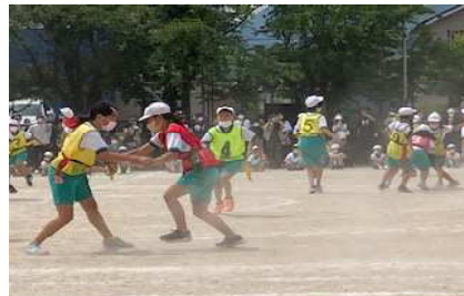
5年生 タグゲットだぜ