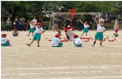
1年生 いけいけ！たまいれびっかびか

子どもたちが、体育学習発表会をやりとげたことで得た達成感や自信を、今後の学校生活に活かしていきます！