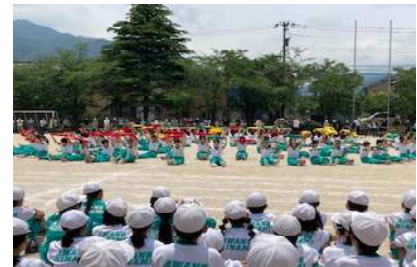
6年生 翔舞 ～心をつに～