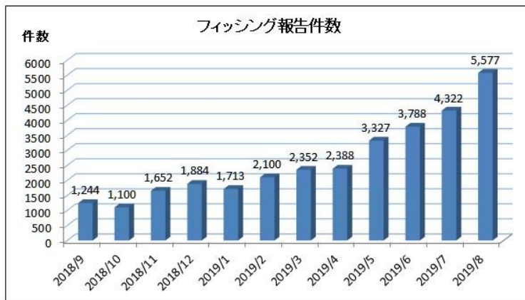
「フィッシング対策協議会」 2019/08 フィッシング報告状況より

フィッシング詐欺の報告件数は増加傾向（右グラフ）にあります。また、最近では手口が巧妙になってきており、下記のように すぐにはフィッシング詐欺であると判別できない ケースも増えてきています。