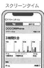
スクリーンタイムの設定方法(動画)