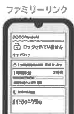
ファミリーリンクについてはこちらから

POINT 2 各ゲーム機にもペアレンタルコントロールのサービスがあります。各説明書やホームページなどで確認し、最初に設定しましょう。